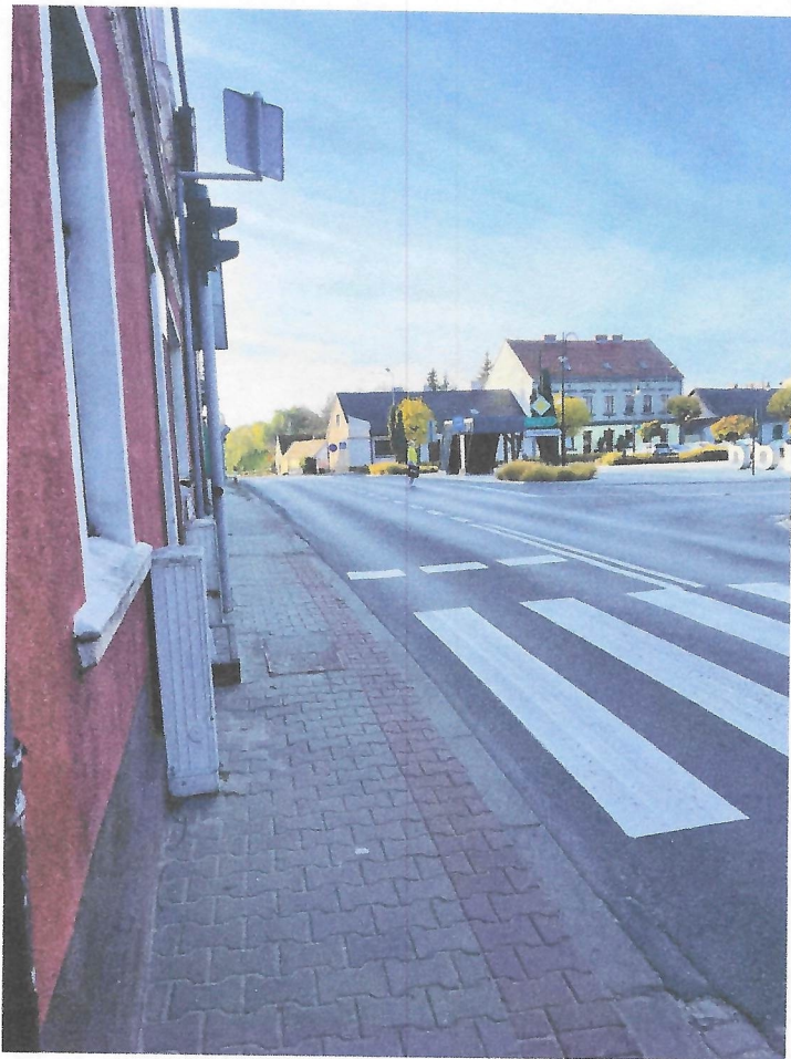
Załącznik nr 3